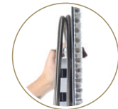
Alüminyum Bal Peteği